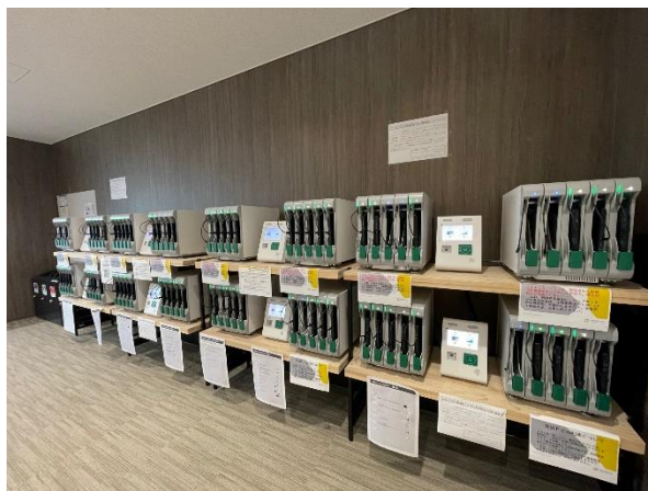
図 2 PC 自動貸出ロッカー

2021 年度に開設した新札幌キャンパスでは、学生が学生証を用いて無人の貸出ロッカー (図 2) より自動で貸出を受けられるノート PC を 80 台配置した。貸出 PC は貸出ロッカーへの格納中に充電とディスクイメージ配信サーバからのイメージ受信・復元を兼ねて USB Type-C ケーブルで有線 LAN により学内 LAN に接続されている。学生により貸出手続きが行われると貸出ロッカーの 1 つが自動で開錠され利用可能な状態となり、貸出 PC は USB Type-C ケーブルの抜去以降は全てキャンパス無線 LAN に接続された状態で動作する。