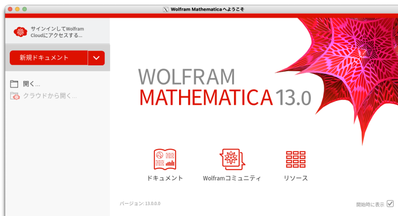
図 1 GUI 版 Mathematica の起動画面

■CUI 版 GUI を使用せず、コマンドライン上で起動することもできます。(リスト 10)