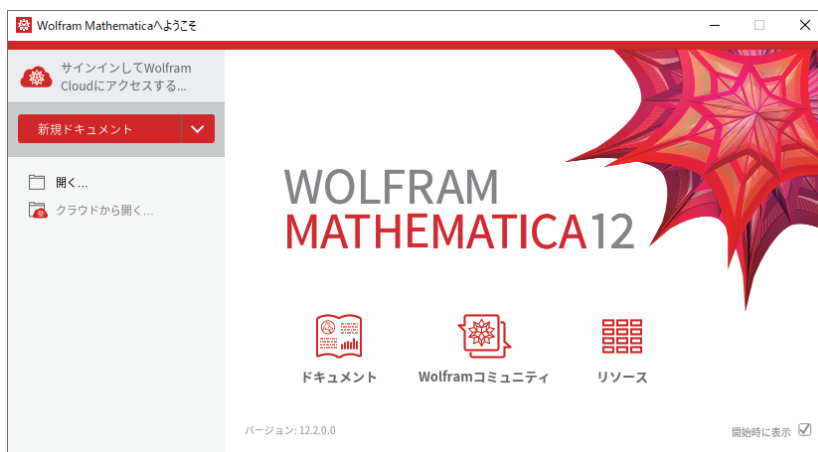
図 1 GUI 版 Mathematica の起動画面

■CUI 版 GUI を使用せず、コマンドライン上で起動することもできます。(リスト 10)