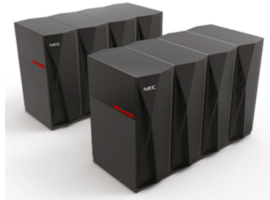
2014年10月運用開始予定の「SX-ACE」