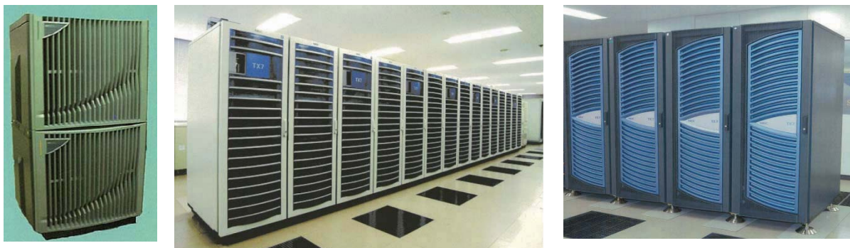
写真1 コンピュータの筐体（計算機室）Exemplar/X(左)、TX7/AzusA(中)、TX7/i9610(右)

Exemplar/X は3ノード導入され、1ノードは16個のCPU（PA8000プロセッサ）と4GBのメモリで構成、TX7/AzusA は7ノード導入され、1ノードは16個のCPU（Intel Itaniumプロセッサ 800MHz）と32GB（4ノードは16GB）のメモリで構成、TX7/i9610 は3ノード導入され、1ノードは32（64Core）個のCPU（Intel Itanium2プロセッサ 1.6GHz）と512GBのメモリで構成されていました。写真1は各コンピュータの筐体です。