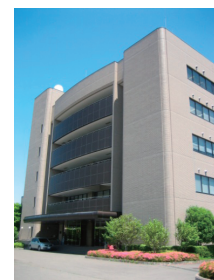
サイバーサイエンスセンター本館