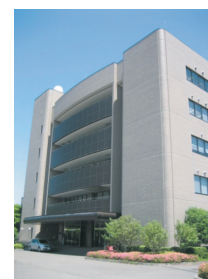
サイバーサイエンスセンター本館